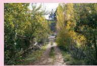
Membrilleros en el Batán

Los Giles, Pedazuelo, La Casica, Tus, El Carrascal, El Villar... y vuelve a bajar hasta encontrarse de nuevo con la carretera del río a la altura de los Baños. A la izquierda la carretera llega hasta las aldeas de Collado Tornero y la Mohedá. Para este recorrido tomaremos como primer tramo la carretera que sube hasta la aldea de los Giles, es la aldea más habitada de todo el hueco, en ella encontraremos panadería, tienda, bar y una gran variedad de dulces caseros. Ya en la aldea de Los Giles, justo enfrente del centro social y de la parada del autobús, continua la ruta entre las casas, baja hasta el arroyo de la Sierra cruzándolo por un puente que nos encontraremos, para adentrarnos por la espesura tupida del frondoso bosque que aquí se forma, donde la humedad y el tipo de suelo hacen que se cree un microclima propio que hacen que se instalen plantas características del bosque mediterráneo. El bello paisaje que recorremos siempre hará pararnos con cada cosa que observemos. Llegaremos a las ruinas del cortijo de Cañada Santilla y giraremos para seguir nuestro camino entre el pinar de pino rodeno, jaras y brezcos que cubren el sotobosque hasta las casas del Batán, de nuevo junto al arroyo de la Sierra. Desde el Batán ya vemos hacia el norte el cerro donde se levantaba el castillico de Tus, destino de nuestra ruta.