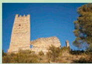
Atalaya de Llano de la Torre

Desde donde se sitúa la torre se pueden apreciar buenas vistas: además del Calar de la Sima y el valle del río Tus, al fondo del valle, río arriba, se observa en la ladera de Moropche otra atalaya; posiblemente ambas torres se comunicaban mediante señales de fuego.