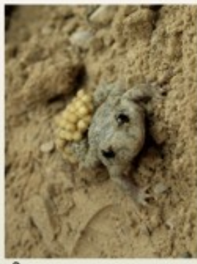
Sapo partero bético (Alytes dickhilleni)