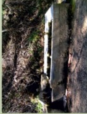
Fuente de la Berra

Cruzando el puente y siguiendo el curso del arroyo pronto salimos al abandonado cortijo El Saltador donde veremos algunos elementos etnográficos como son, varios hornos y las ruinas de una vieja almazara que aprovechaba la fuerza del agua para la molienda de la aceituna.