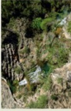
Cascadas de El Saltador.

Una vez visitadas las Cascadas, retrocedemos hasta El Saltador para seguir la senda que cruza el arroyo y ascender hasta el camino de la Olla. Al borde del camino encontraremos una calera, horno que en su momento albergó una bóveda de roca caliza y que tras ser calentada a fuego intenso durante tres días y tres noches convirtieron en cal viva. Siguiendo el camino pasaremos el cortijo de La Olla de D. Juan y ascenderemos entre olivos por el camino que nos lleva al cortijo de Cuesta de Yecar para bajar de nuevo por una senda hasta Arroyo madera, completando así el tramo circular. Podemos volver desde la almazara también a Arguellite, por una senda que nos conduce hasta la carretera AB-513.